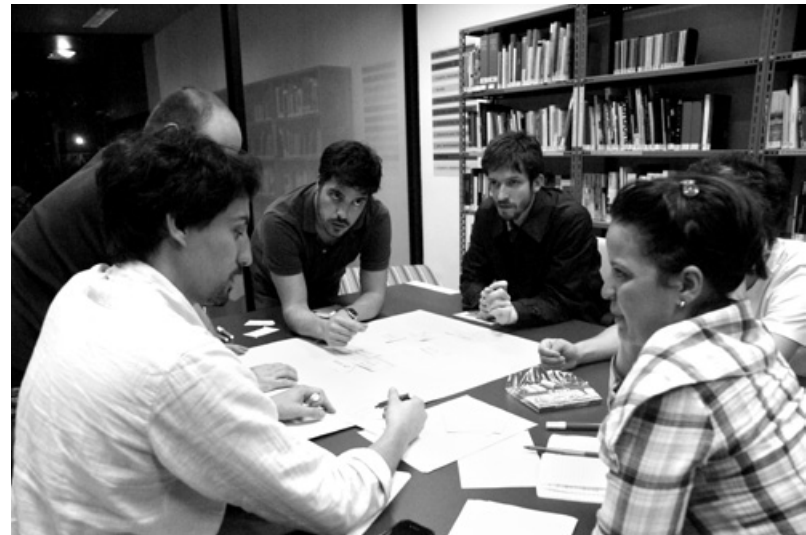
Curadoria e Contexto.

Aula aberta ao público Data 27 out | Horário 19h30 às 22h30 | Local CCE_SP, Av Angélica, 1091 – Higienópolis, São Paulo SP | Streaming no site + info www.forumpermanente.org/event_pres/oficinas-de-curadoria/curadoria-e-contexto