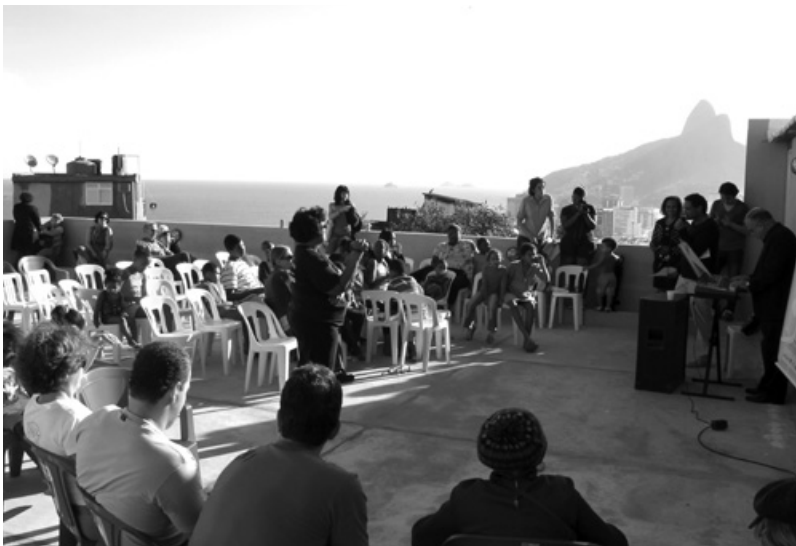
Foto da inauguração das Obras do Terraço Cultural do Museu de Favela.