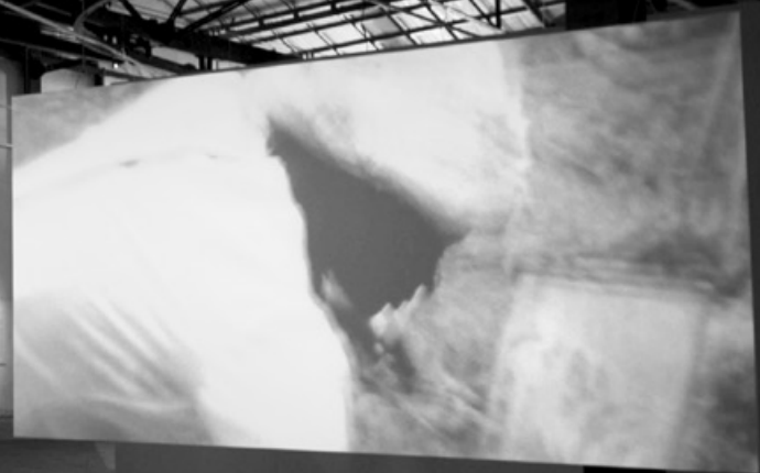
Imagem da obra O Veneno do baile , do artista espanhol Paco Cao. Ele, junto a Cristina Lucas e Santiago Sierra, são os representantes espanhóis com apoio da AC/E (Acción Cultural Española) que participam na 8ª Bienal do Mercosul.